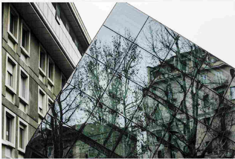
Il nuovo ingresso

Non si ritroverà la giovinezza e nemmeno le forze dei vent'anni come accadeva nel film Cocoon, ma sicuramente le occasioni di riabilitazioni post traumatiche e i trattamenti specifici in acqua diverranno un'opportunità, considerata la rarità di avere strutture che offrano questo servizio.